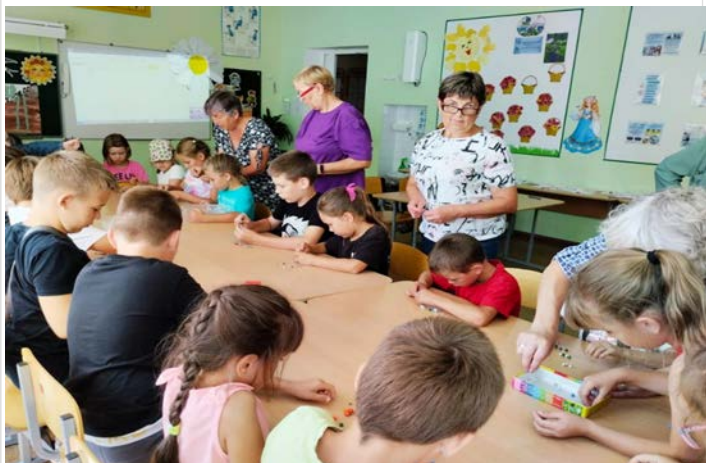
Участницы клуба активного долголетия «Любава»

16 августа «серебряные» волонтеры побывали в пришкольном оздоровительном лагере МАОУ Горьковская СОШ. Они провели мастер-класс «Плетение браслета из бусин». Рассказали и показали ребятам, как плетётся браслетик. Ребята с удовольствием плели браслеты, не только девочки, но и мальчики. У всех получились красивые и своеобразные украшения.